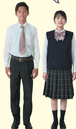
Spring & Autumn style

ポロシャツは男女ともに 紺色とピンクの 2種類があって 気分でイメチェン できるよ!